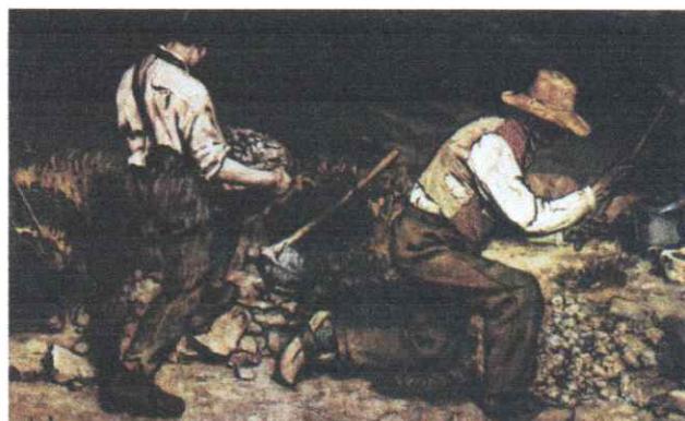
Gustave Courbet Kamieniarze