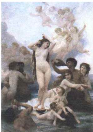
Adolphe-William Bouguereau Narodziny Wenus