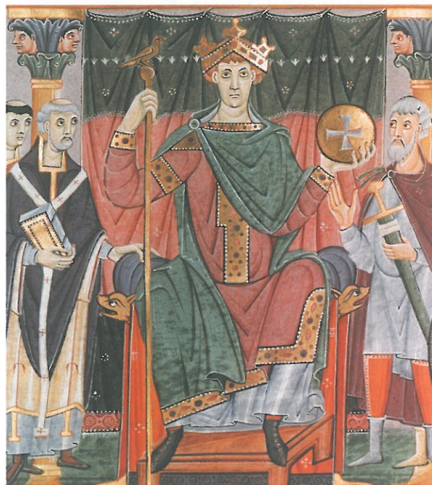
Cesarz Otton III z dynastii Ludolfingów został przedstawiony na miniaturze jako pan świata (łac. dominus mundi ) – na tronie i z symbolami władzy: koroną, jabłkiem oraz laską z orłem. Po prawej stronie monarchy ukazano rycerzy, a po lewej – duchownych. W ten sposób zilustrowano zależność poddanych świeckich i przedstawicieli Kościoła od woli władcy.

Ideę uniwersalizmu cesarskiego wdrażali w życie następcy Ottona I: Otton II oraz Otton III . Ten ostatni dążył do utworzenia imperium obejmującego również Bizancjum. Najwyższa władza w tym państwie – zarówno duchowna, jak i świecka – miała należeć do cesarza. Aby zrealizować swoje zamiary, Otton III musiał uzyskać poparcie głowy Kościoła. Dlatego papieżami zostawali oddani mu ludzie. Cesarz zamierzał też pozyskać dla swoich planów polskiego księcia Bolesława Chrobrego , którego uważał za doskonałego kandydata na przyszłego władcę całej Słowiańszczyzny.