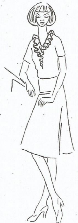
Rys. 107. Wolant z żabotem krojony w kształcie spirali – rysunek żurnalowy i konstrukcyjny w etapach I÷V