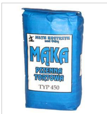
Rysunek 2.2 Typ mąki

Rodzaj mąki określany jest na podstawie rodzaju ziarna, z którego mąka została wytworzona, oraz typu mąki. Typ mąki określa zawartość popiołu, czyli związków mineralnych wyrażonych w gramach na sto kilogramów mąki. Typ mąki wyrażony liczbowo oznacza procentową zawartość popiołu pomnożoną przez tysiąc. Dla przykładu: mąka pszenna poznańska typu 500 zawiera 0,5% popiołu.