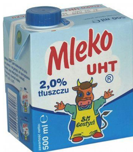
Rysunek 2.3 Mleko UHT

Mleko krowie stanowi 90% produkcji. Jest ono źródłem wysokowartościowych białek, głównie kazeiny, łatwo przyswajalnego tłuszczu, a także witamin z grupy A, B i D. W obrocie towarowym najczęściej spotykane jest mleko: pasteryzowane, sterylizowane i koncentraty mlekne.