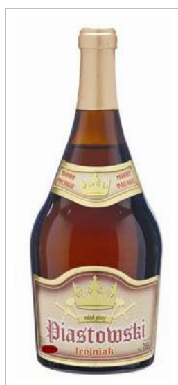
Rysunek 2.8 Miód pitny trójniak