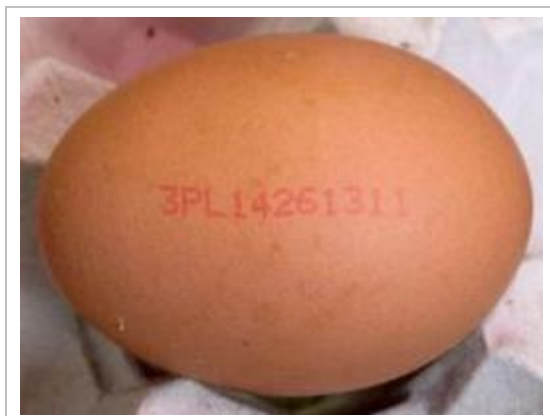
Rysunek 2.4 Znakowanie jaj