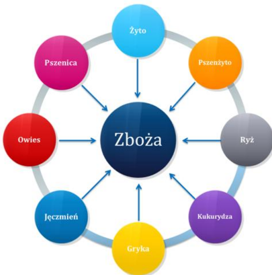
Rysunek 2.1 Podział zbóż

Zboża to rośliny, które wytwarzają ziarno. Ziarno jest przetwarzane na produkty zbożowe.