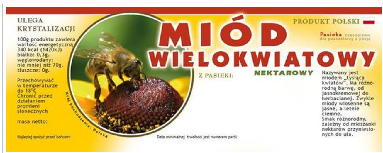
Rysunek 2.7 Etykieta miodu

Etykieta miodu powinna zawierać informację dotyczącą odmiany miodu.