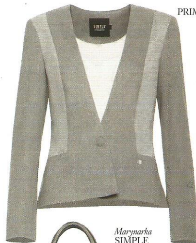
Marynarka SIMPLE 699,90 zł