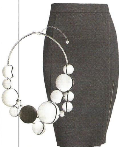
Kolia W.KRUK 999 zł