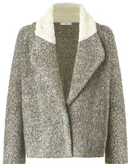
Kurtka MANGO 199,90 zł