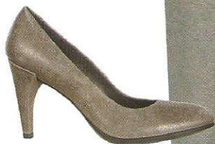
Szpilki ECCO 519,90 zł