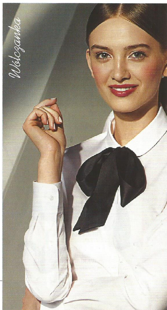
Spódnica GATTA 139,90 zł