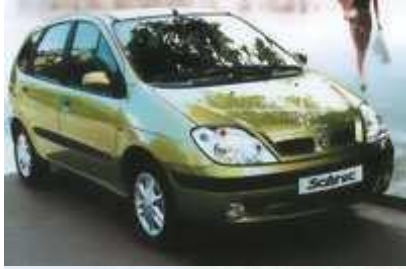
Tabela 2. Klasyfikacja nadwozi samochodów osobowych w zależności od układu brył nadwoziowych [13, s. 19].